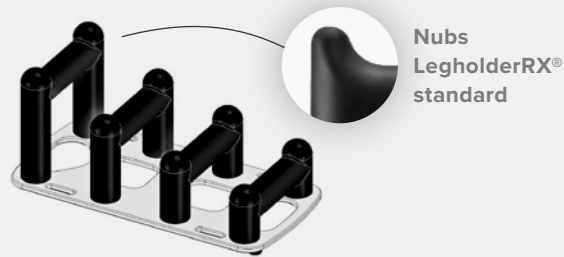
Nubs LegholderRX® standard